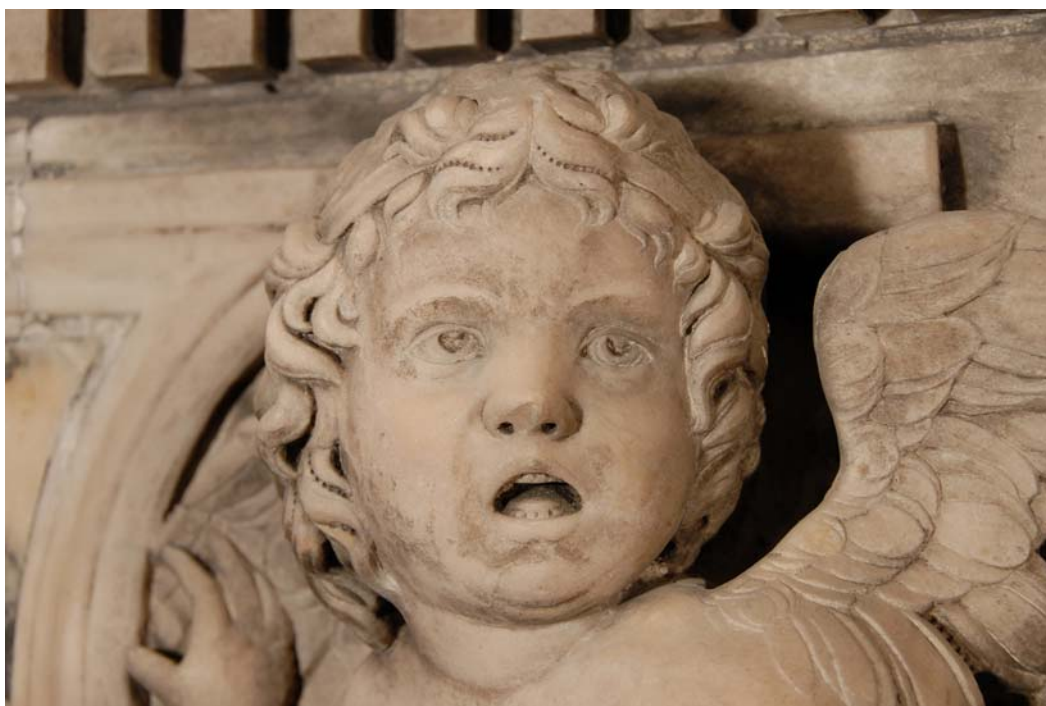
PARTICOLARE DI UNA SCULTURA DELLA CAPPELLA DELL'ARCA DEL SANTO DOPO IL RESTAURO

Docente presso Facoltà Teologica del Triveneto