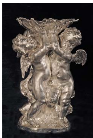
PARTICOLARE CANDELABRO DOPO IL RESTAURO